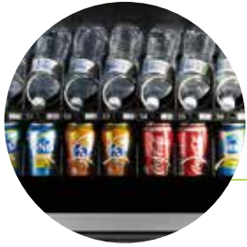
Máxima flexibilidad de la oferta