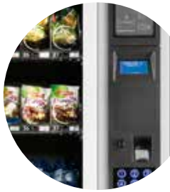
Diseño sencillo y características de top de gama