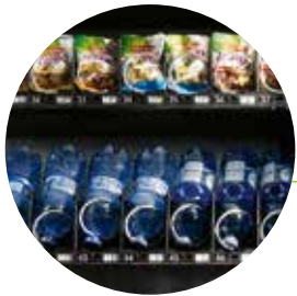
Vitrina con temperatura estratificada